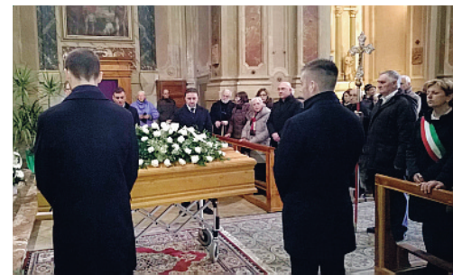
Due momenti dei funerali di Mario Lodi a Drizzona, Piadena, nel Cremonese

e che bisognerà cercare di ricordare il suo impegno e le sue opere guardando avanti e cer-