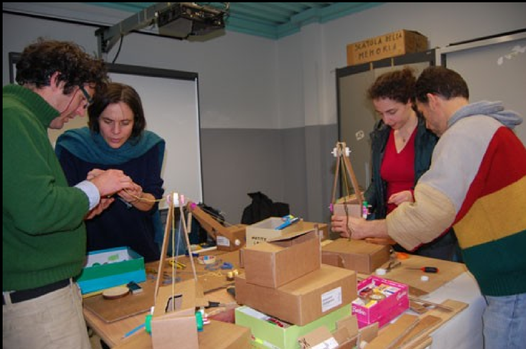
Giocattoli di cartone.