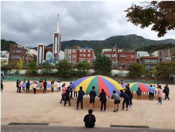
School Festival – Prima

Hanno organizzato immediatamente i programmi di formazione per l'utilizzo della piattaforma Internet, i programmi di videoconferenza, etc.; gli insegnanti senior-junior si sono aiutati a vicenda in questa crisi con tutta la loro anima. La velocità con cui gli insegnanti si sono adattati alle lezioni online e la velocità con cui aiutano tutti gli studenti a seguire le lezioni online a casa loro, sono state incredibilmente rapide. Gli insegnanti delle scuole superiori sorvegliavano gli studenti online, quelli senza un PC di classe, o senza una connessione a Internet. Le scuole e le autorità scolastiche hanno prestato agli studenti tablet PC, e fornito cestini per il pranzo, durante tutta la scuola on-line. All'inizio di maggio, il numero dei pazienti confermati da Corona 19 si è fissato a 10, o meno, al giorno, e il Ministero ha deciso di riaprire la scuola. Prima di ricominciare, la nostra scuola ha installato un costoso termometro termoisolante (costo circa 7.000 euro) fornito dall'Ufficio Metropolitano dell'Educazione di Busan. La disinfezione antisettica che era stata eseguita periodicamente è stata rafforzata. Non solo è stato attaccato ai pavimenti della scuola un adesivo della forma della suola per fissare una distanza di più di 1 metro, ma è stata cambiata anche la disposizione dei banchi e delle sedie degli studenti, con schermature trasparenti nelle mense dove il rischio di infezione è particolarmente alto.