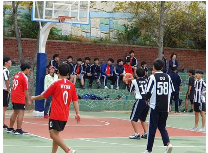
Basket - Prima