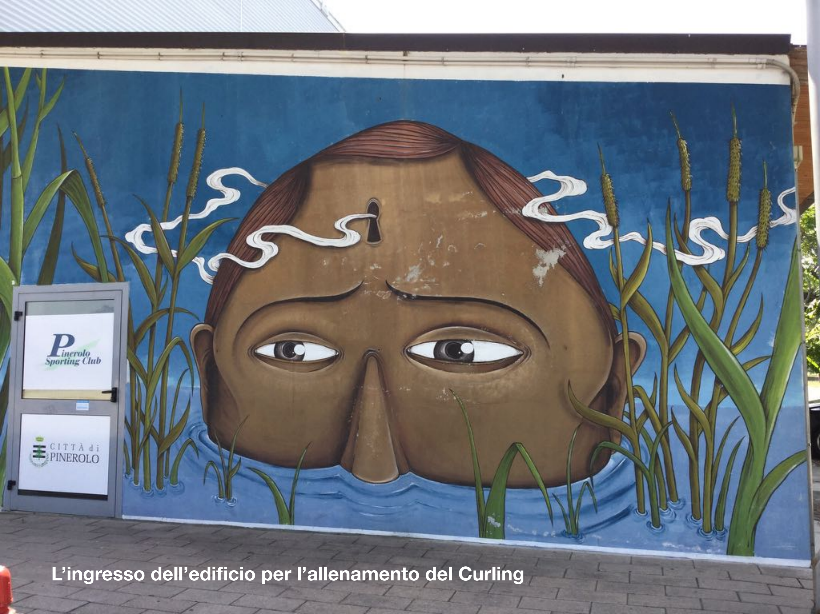
L'ingresso dell'edificio per l'allenamento del Curling