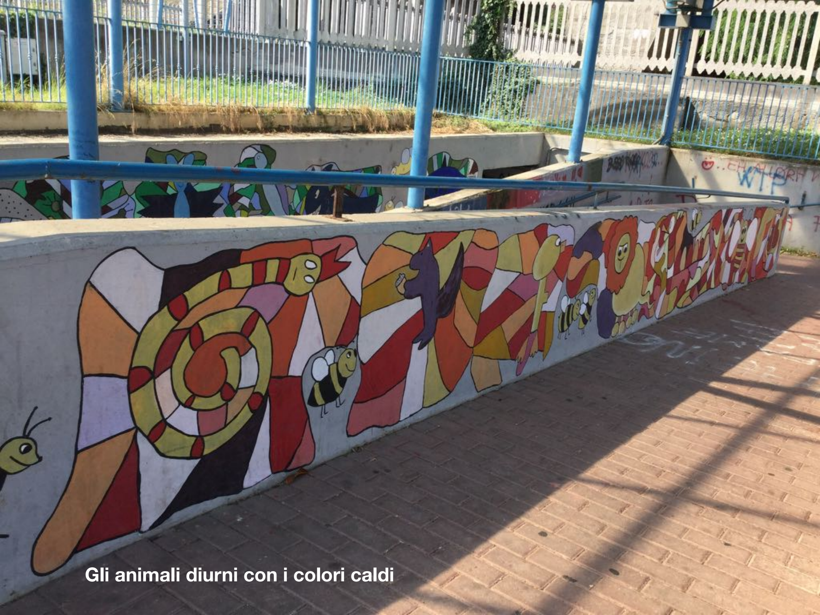
Gli animali diurni con i colori caldi