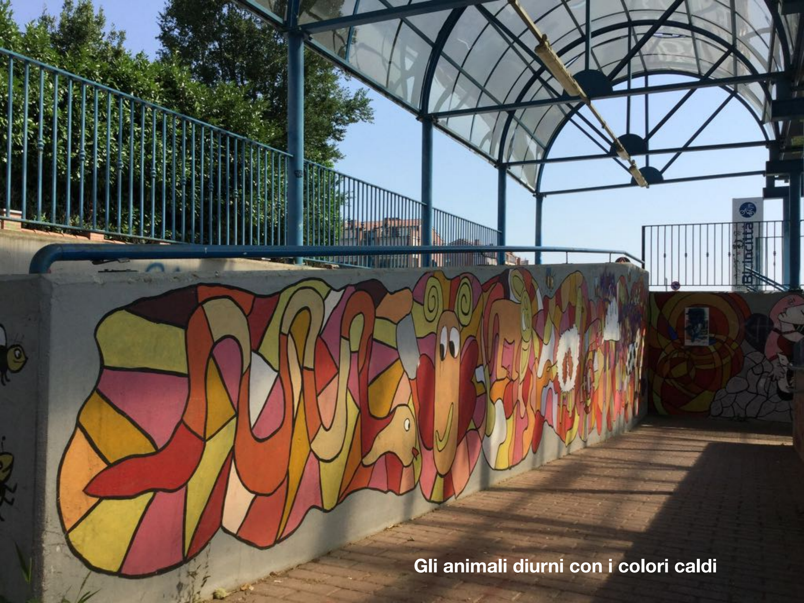
Gli animali diurni con i colori caldi