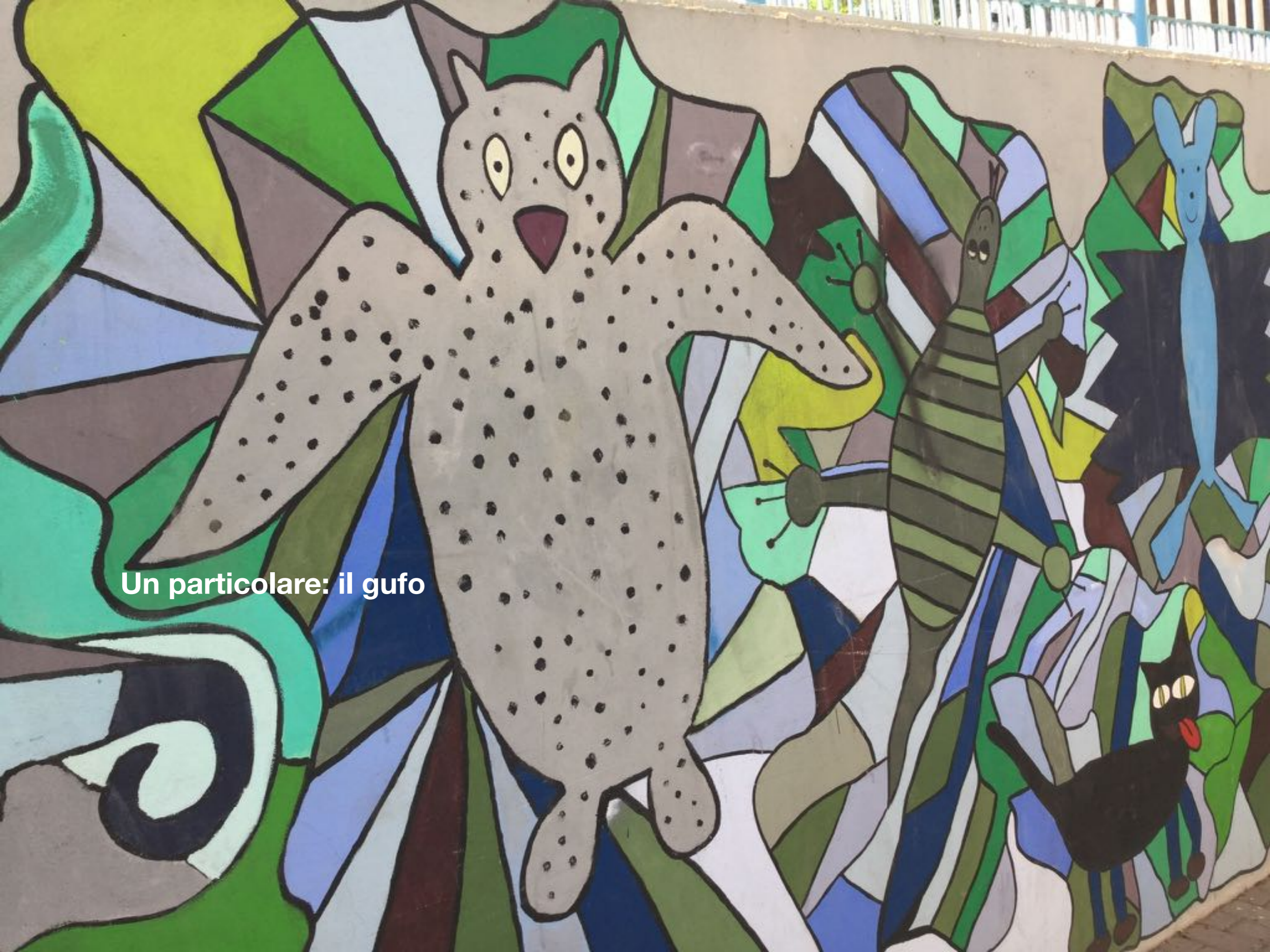
Un particolare: il gufo