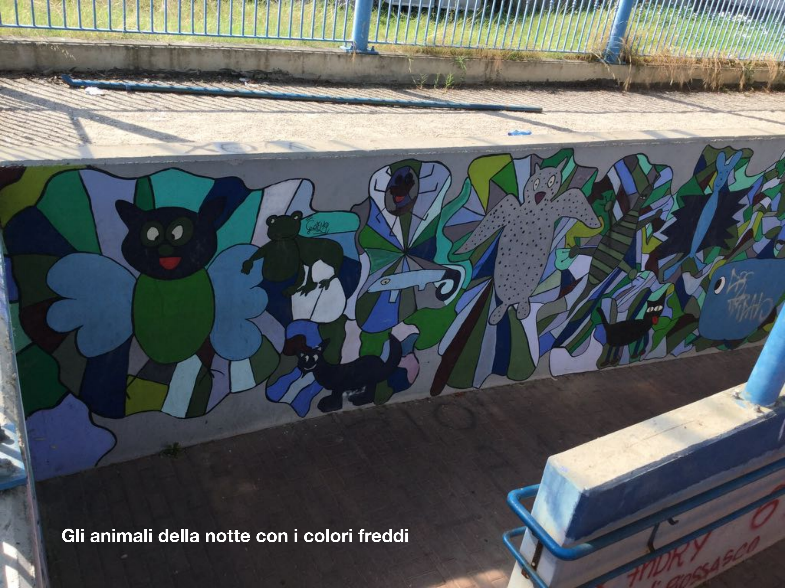
Gli animali della notte con i colori freddi