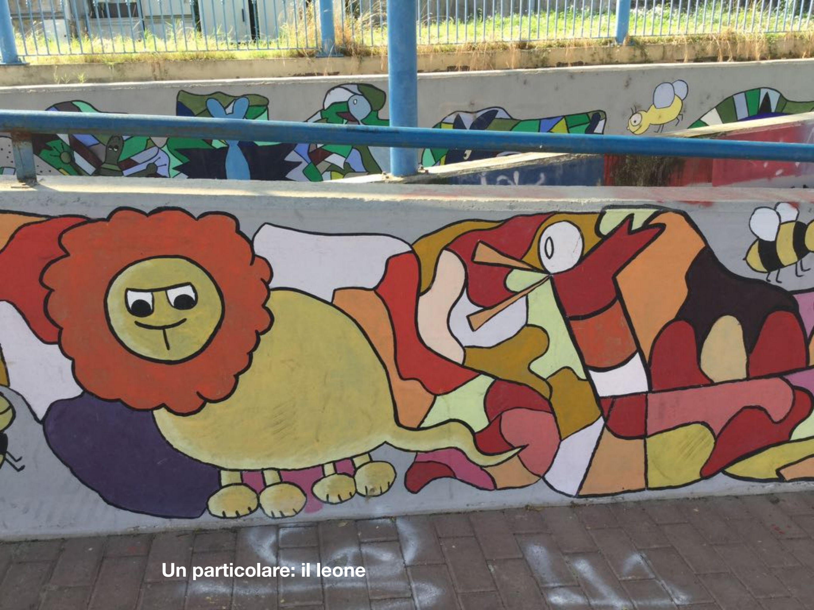
Un particolare: il leone