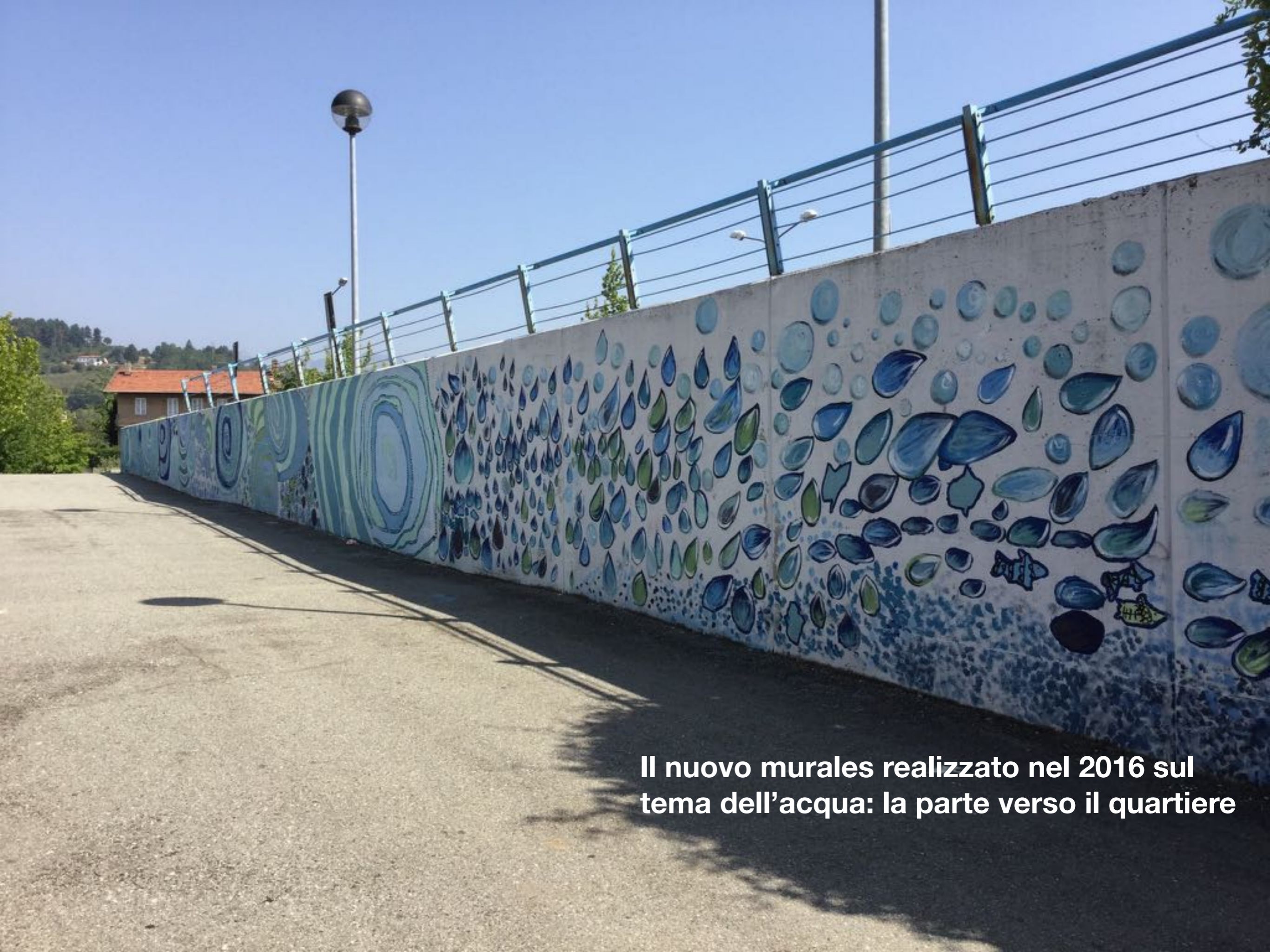
Il nuovo murales realizzato nel 2016 sul tema dell'acqua: la parte verso il quartiere