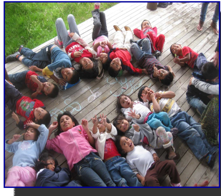
Le foto del depliant sono state fornite da Giancarlo. Cavinato