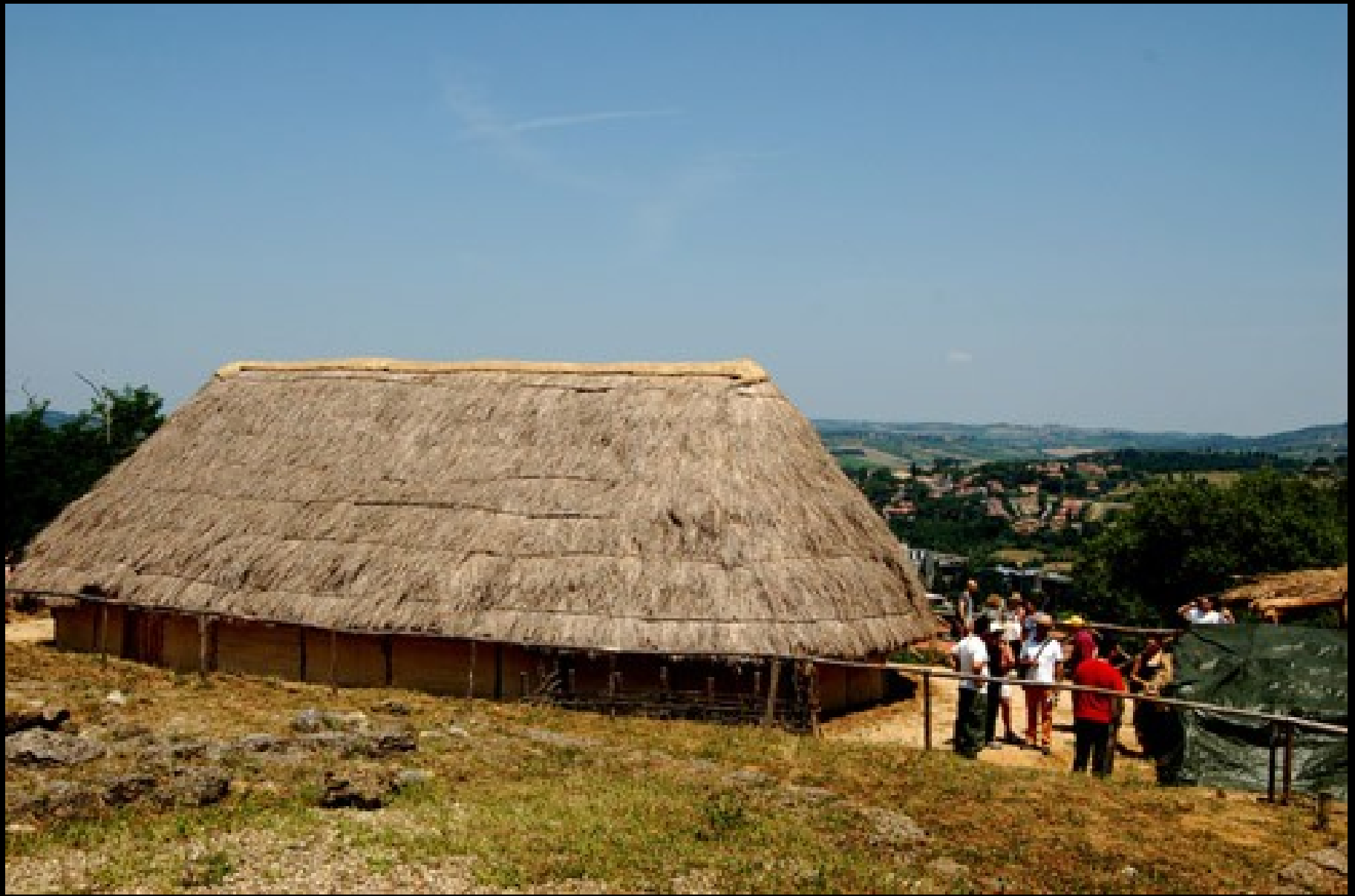
La ricostruzione del villaggio longobardo.